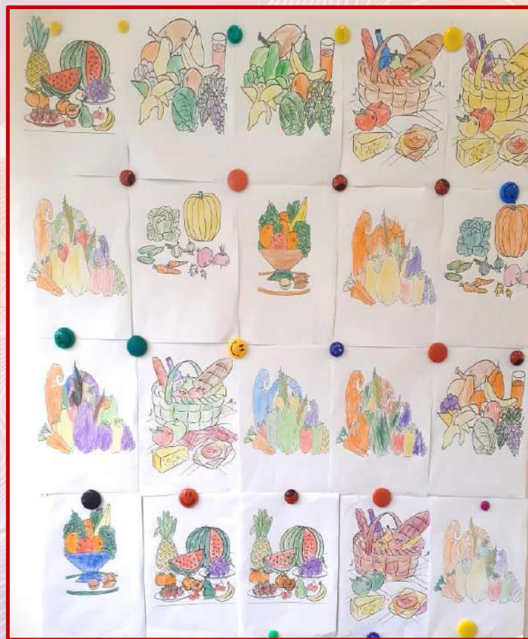
Выставка детских работ