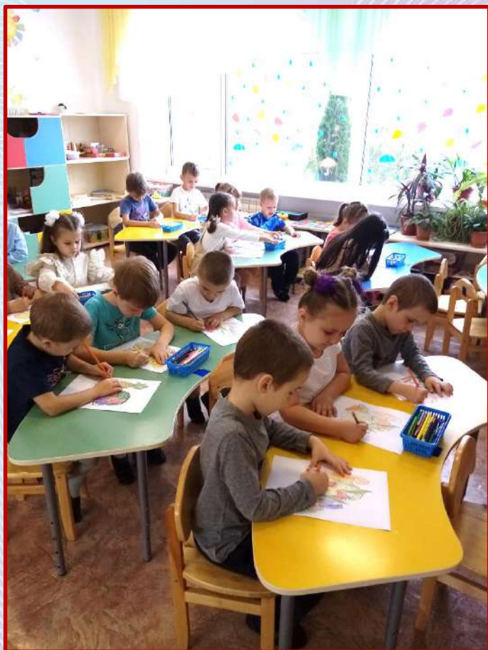
Продуктивная деятельность с детьми