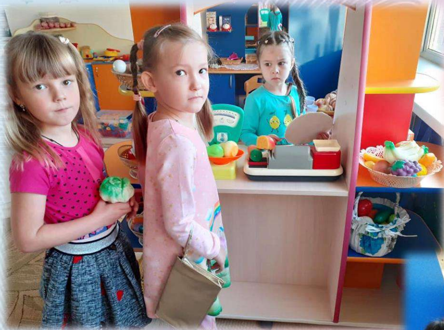
В магазин за полезными продуктами