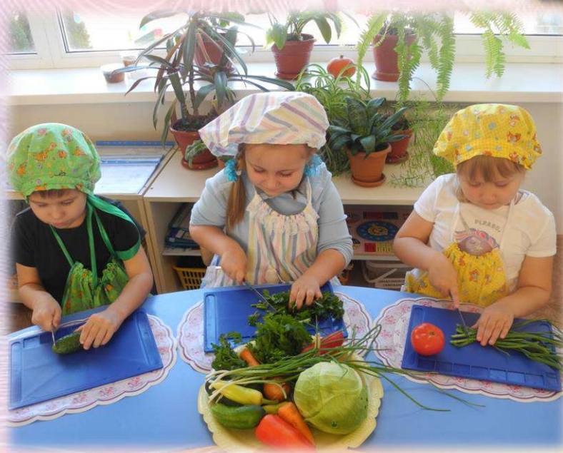
Делаем витаминный салатик