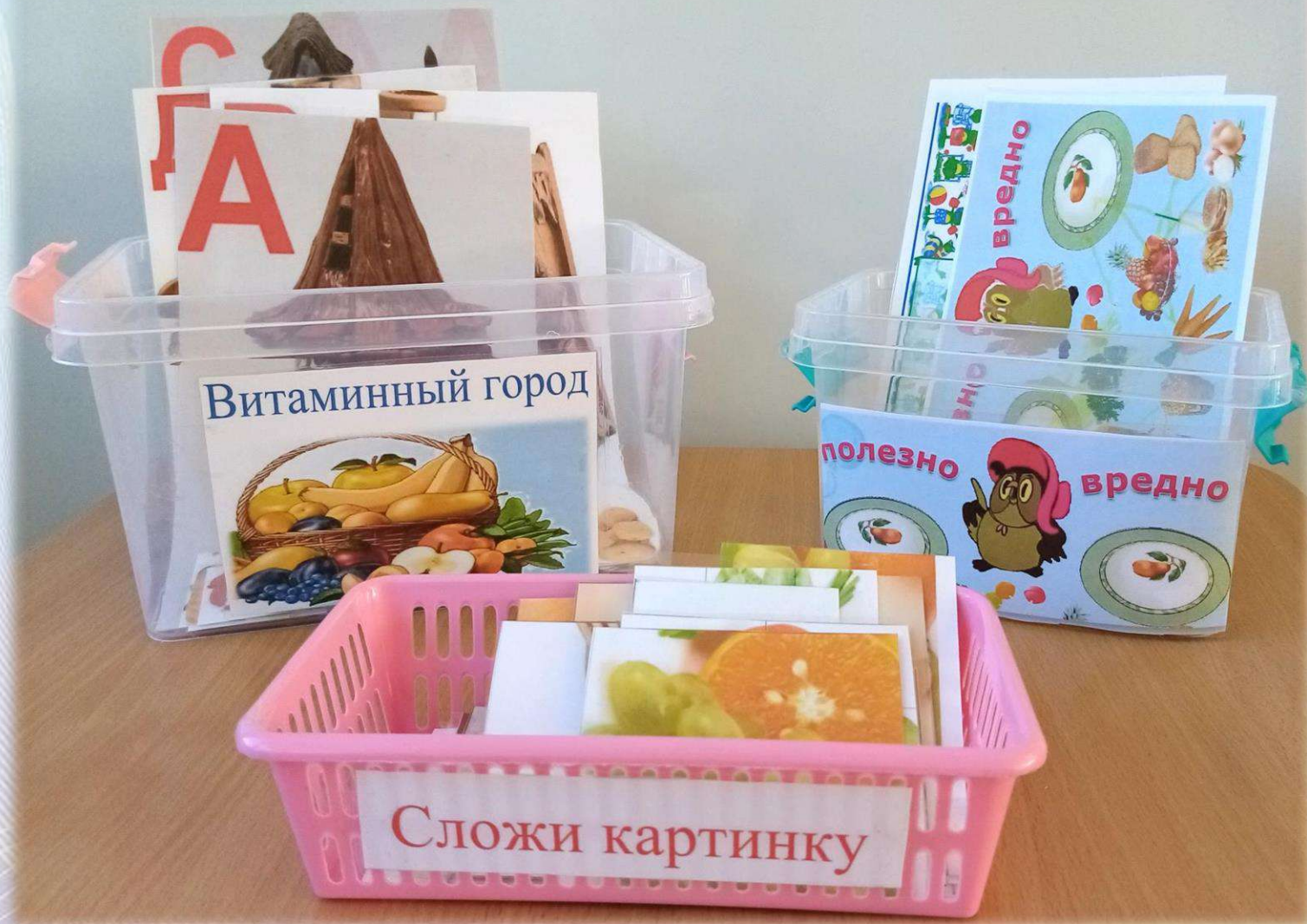
Настольно-печатные и дидактические игры