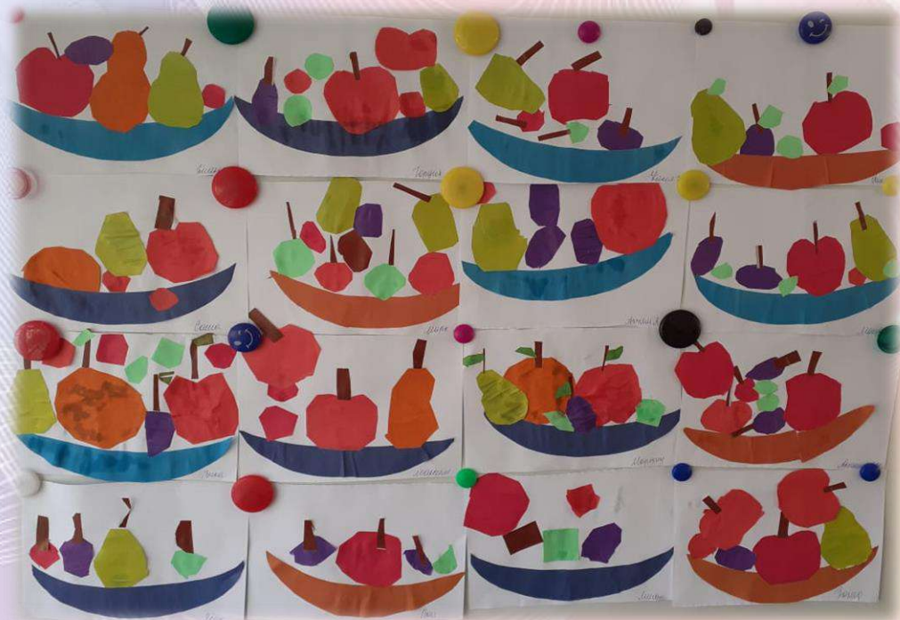
Выставка детских работ